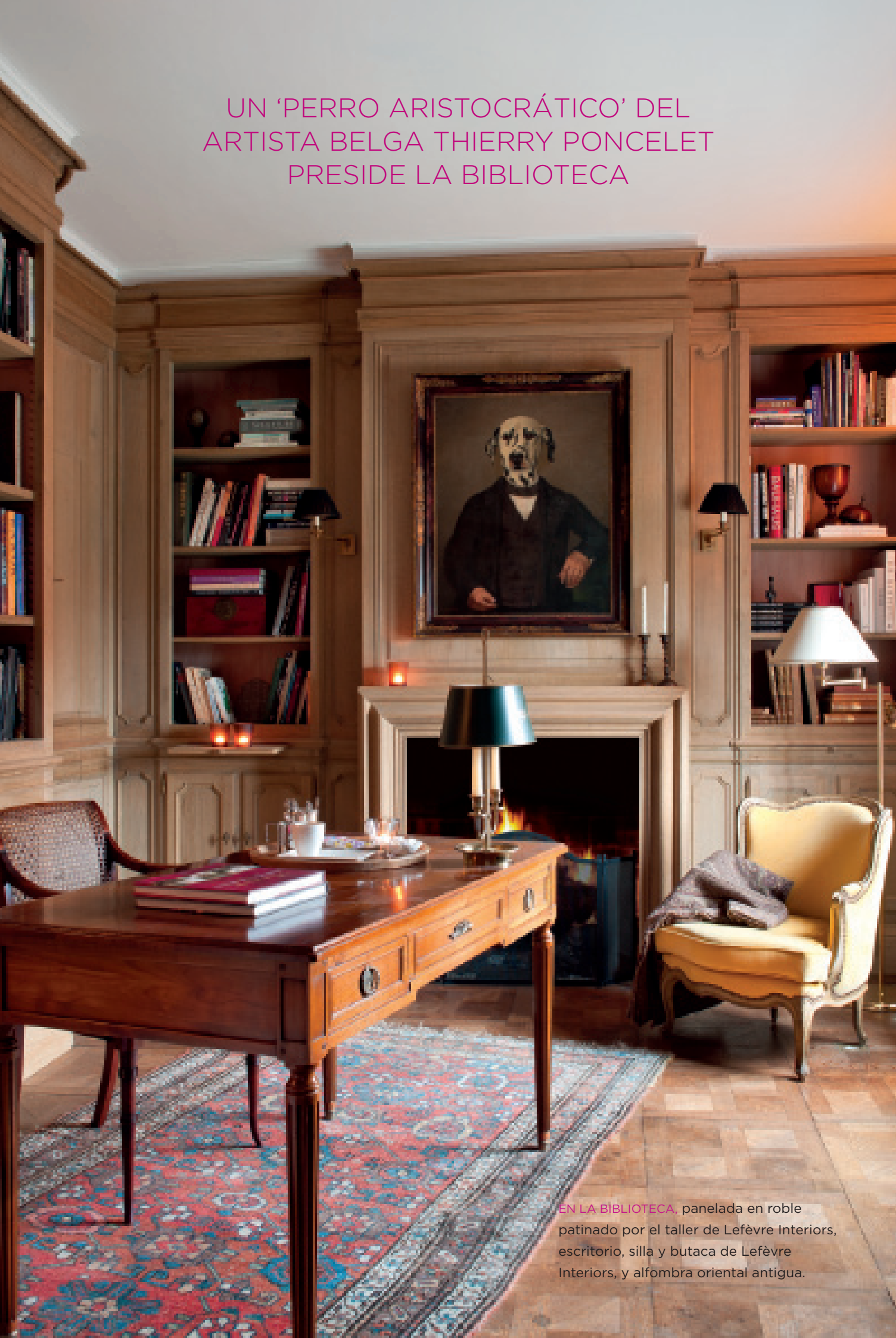
EN LA BIBLIOTECA, panelada en roble patinado por el taller de Lefèvre Interiors, escritorio, silla y butaca de Lefèvre Interiors, y alfombra oriental antigua.

EN LA ENTRADA y el pasillo, suelo de piedra belga negra de Mazy y mármol de Carrara blanco. Barandilla de hierro, reproducción de un modelo antiguo, y cómoda lacada en rosa, de Moissonnier.