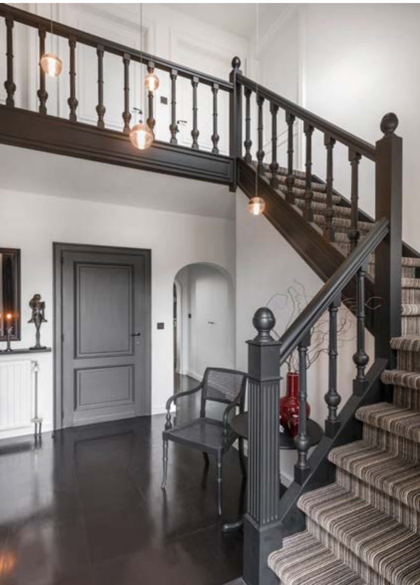
De natuurstenen vloer in de hal werd zwart geschilderd. De traploper is gemaakt van tapijt uit de collectie Les Milleraies van Jules Flipo. De verlichting in de hal is van het merk Bocci.