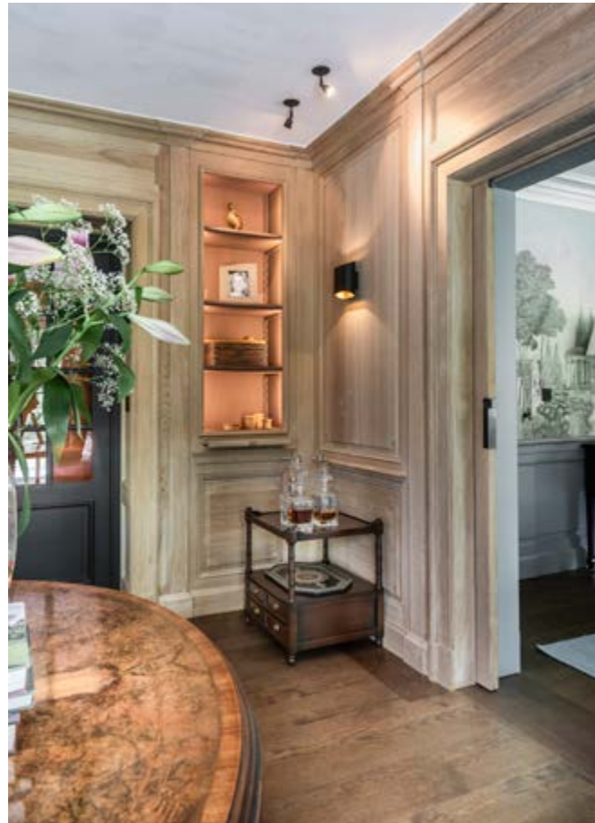
De op maat gemaakte schuifdeuren (Lefèvre Interiors) geven vanuit de eetkamer toegang tot de zitkamer.