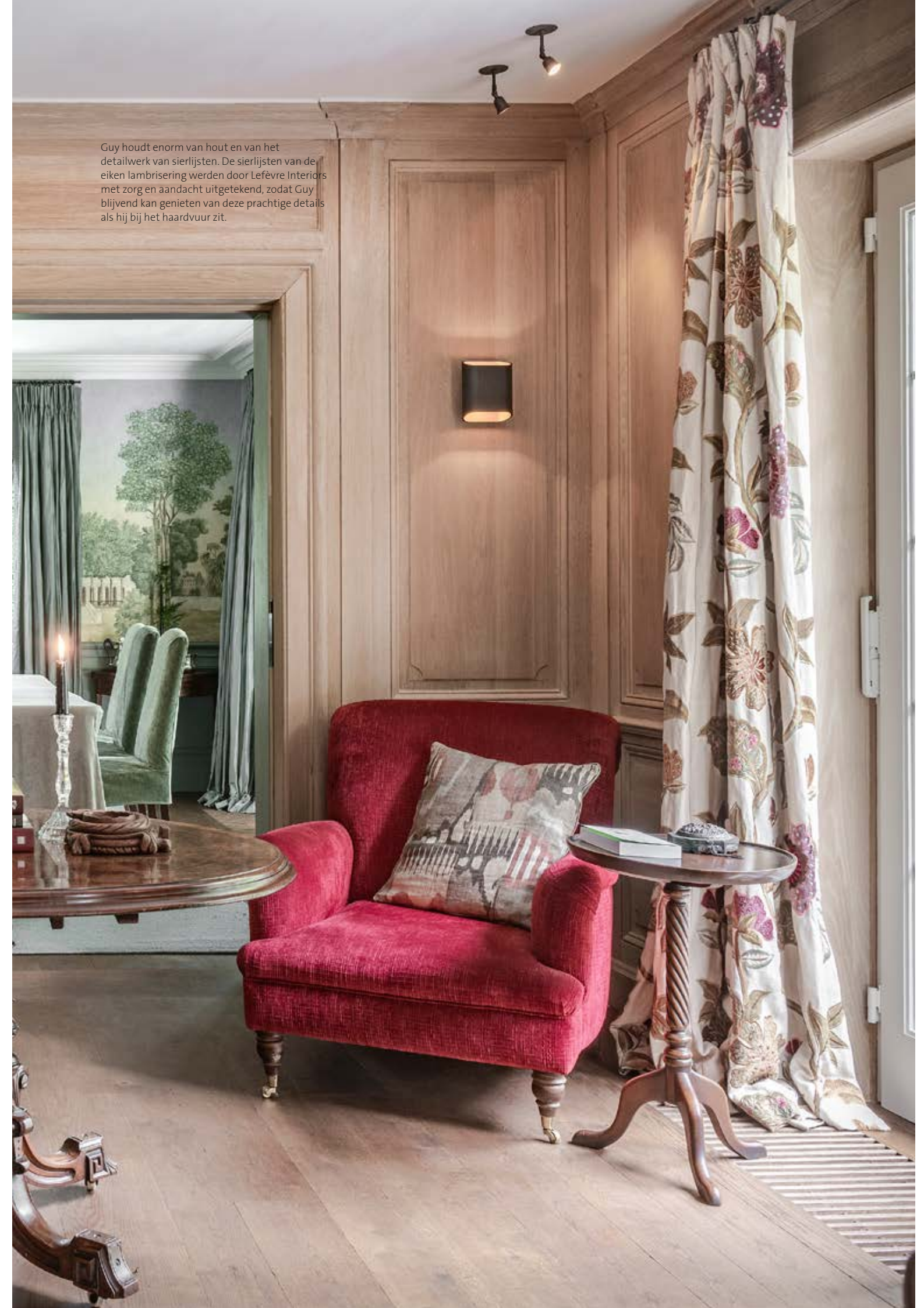
Guy houdt enorm van hout en van het detailwerk van sierlijsten. De sierlijsten van de eiken lambrisering werden door Lefèvre Interiors met zorg en aandacht uitgetekend, zodat Guy blijvend kan genieten van deze prachtige details als hij bij het haardvuur zit.

“Het interieur is een perfecte samensmelting van onze beide smaken” VERONIQUE, BEWOONSTER