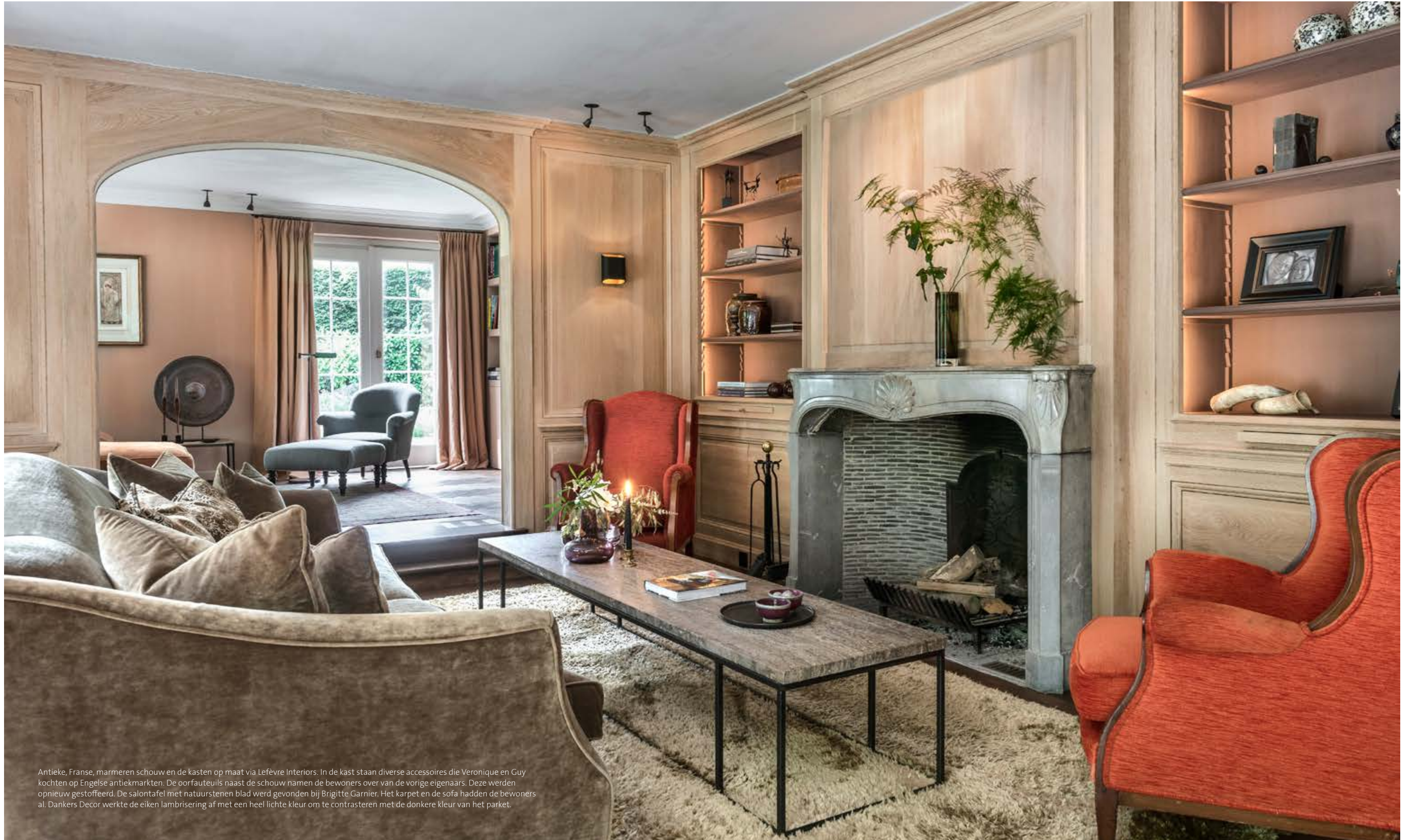
Antieke, Franse, marmeren schouw en de kasten op maat via Lefèvre Interiors. In de kast staan diverse accessoires die Veronique en Guy kochten op Engelse antiekmarkten. De oorfauteuils naast de schouw namen de bewoners over van de vorige eigenaars. Deze werden opnieuw gestoffeerd. De salontafel met natuurstenen blad werd gevonden bij Brigitte Garnier. Het tapijt en de sofa hadden de bewoners al. Dankers Decor werkte de eiken lambrisering af met een heel lichte kleur om te contrasteren met de donkere kleur van het parket.